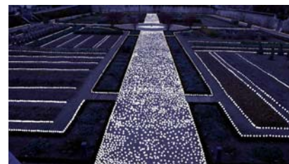
Muma, Vorschau auf die Beleuchtung des Château de Prangins